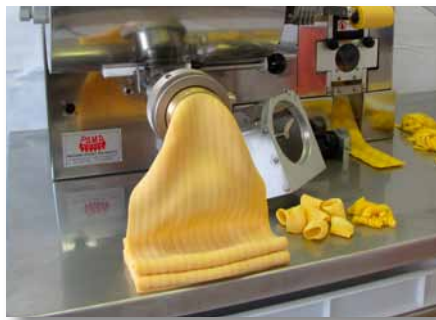
Pressa impastatrice Extruder pasta machine