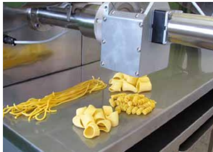
Gruppo di taglio paste corte Cutter group for short cuts