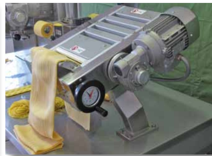
Sfogliatrice e Taglierina Sheeter and Cutter machine