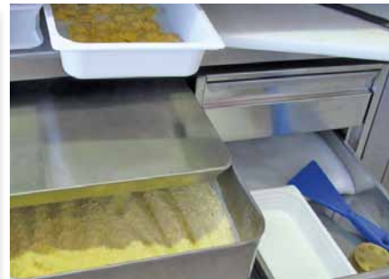
Contenitore farina e cassettera Container for flour and chest

Soluzione brevettata consigliata per piccoli Pastifici, Supermercati, Ristoranti, Agriturismi e Gastronomie. Patented solution, the most useful for Pasta Shops, Restaurants, Supermarkets, Farm Holidays and Delicatessens.