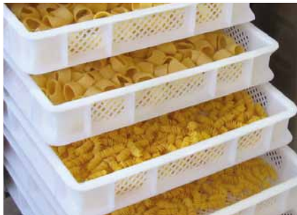
Asciugatoio 7 telai Drier with 7 frames