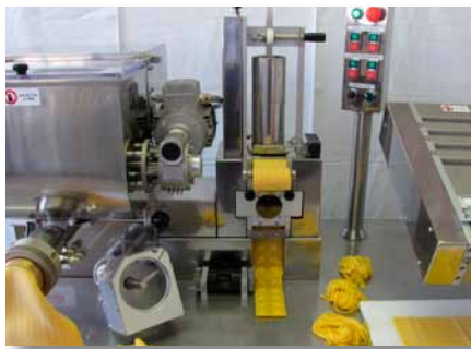
Raviolatrice Ravioli machine